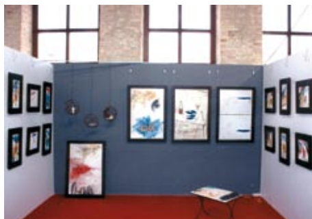
Stands 55-56 Íñigo Dueñas