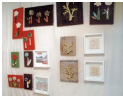
Stands 53-54 Charo Cimas